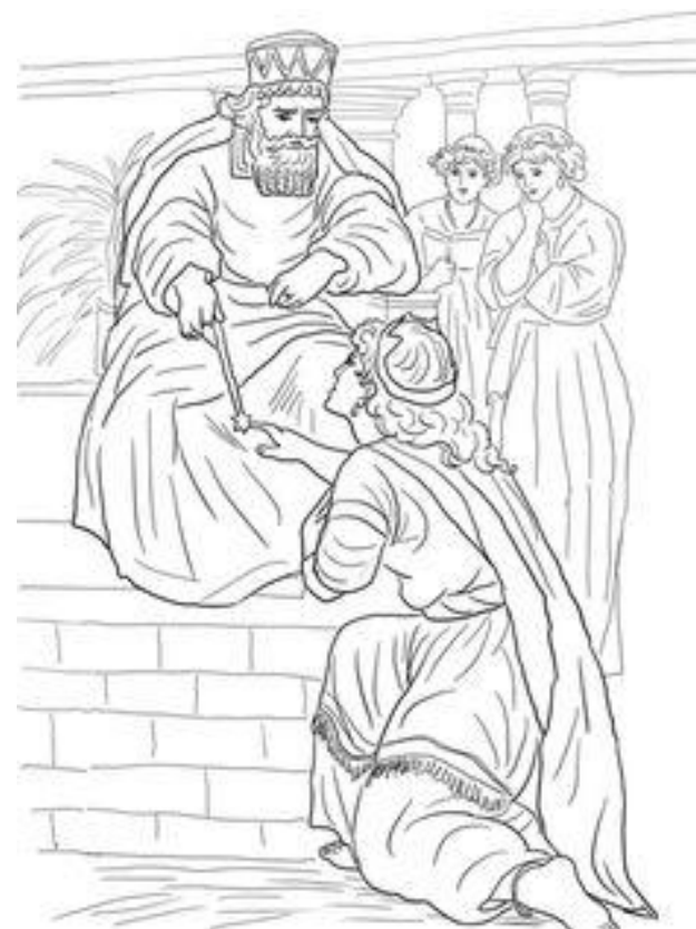
La Reine Esther devant le Roi Assuérus