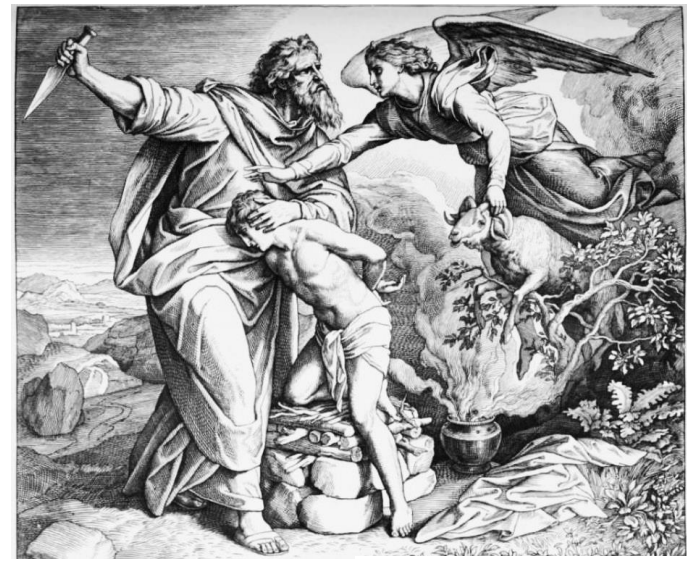
Abraham et le sacrifice d'Isaac

Quand il eut pris le vinaigre, Jésus dit : « Tout est accompli. » Puis, inclinant la tête, il remit l'esprit.